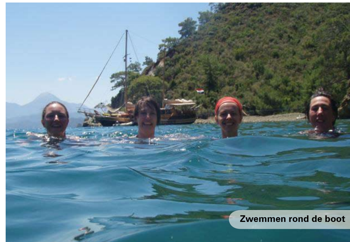
Zwemmen rond de boot