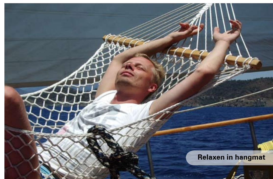
Relaxen in hangmat