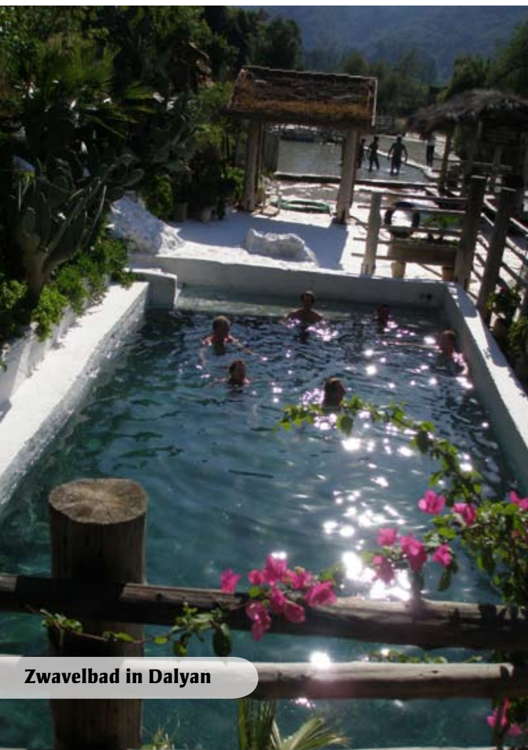
Zwavelbad in Dalyan

Heerlijk verwend worden in een van de authentieke Turkse badhuizen. Wie in 2009 boekt bij zonnigzeilen.nl krijgt een leuke verrassing en een bezoek aan de traditionele Hamam gratis. Zorgeloos zeilen en genieten. Deze aanbiedingen zijn exclusief vliegreis. Voor de voorwaarden en voor meer informatie over de zeilcruise en het appartement kun je kijken op www.zonnigzeilen.nl/aanbieding . Of bel met Germaine, tel: 0090 53 83 678 999.