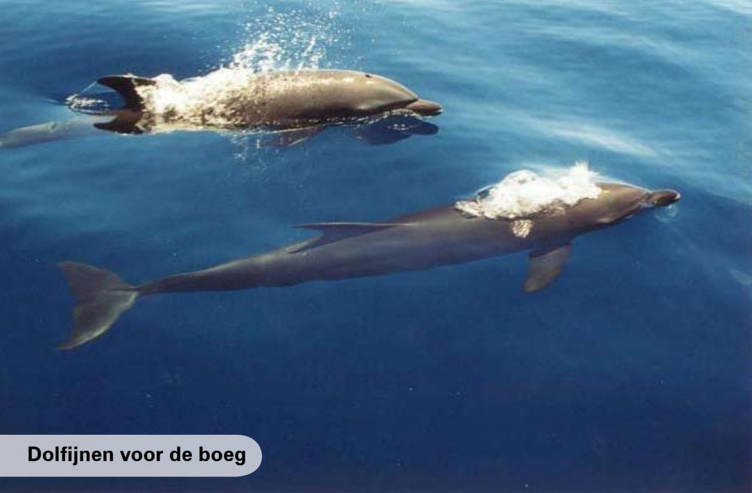
Dolfijnen voor de boeg

er gelukkig in de boot in de richting van een boei te manoeuvreren waaraan ze zich kunnen vasthouden. Iedereen veilig aan boord gebracht, enkele reanimatiepogingen ondernomen, maar dat verrekke ding wil niet meer aanslaan. Dan maar aanmeren met de grote boot en met de bus naar de markt.